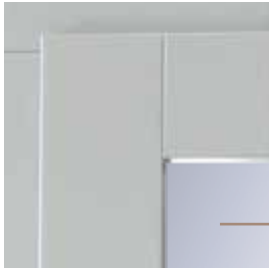
Mouluration de l'ouvrant esthétique plate au design moderne.