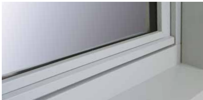
Jet d'eau filant Côté extérieur.