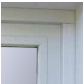
Pareclose ligne épurée.